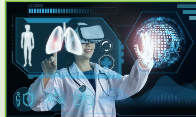
Duitsland, AI in de zorg, 2023