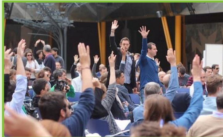
Spanje, klimaat 2022