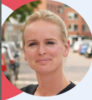
Anneke Grummel (wethouder Heemstede)