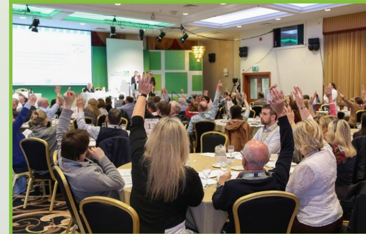
Ierland, drugsbeleid 2023