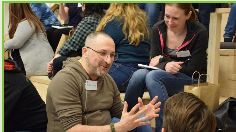
Zweden, voedsel 2023