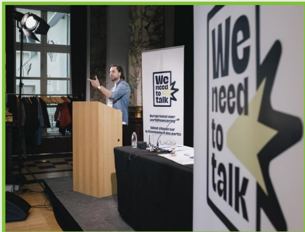
België, partijfinanciering, 2023